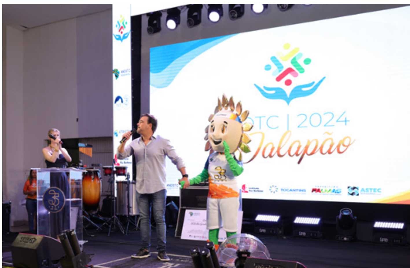
Festa de encerramento com o mascote das Olimpíadas, "Solzito"