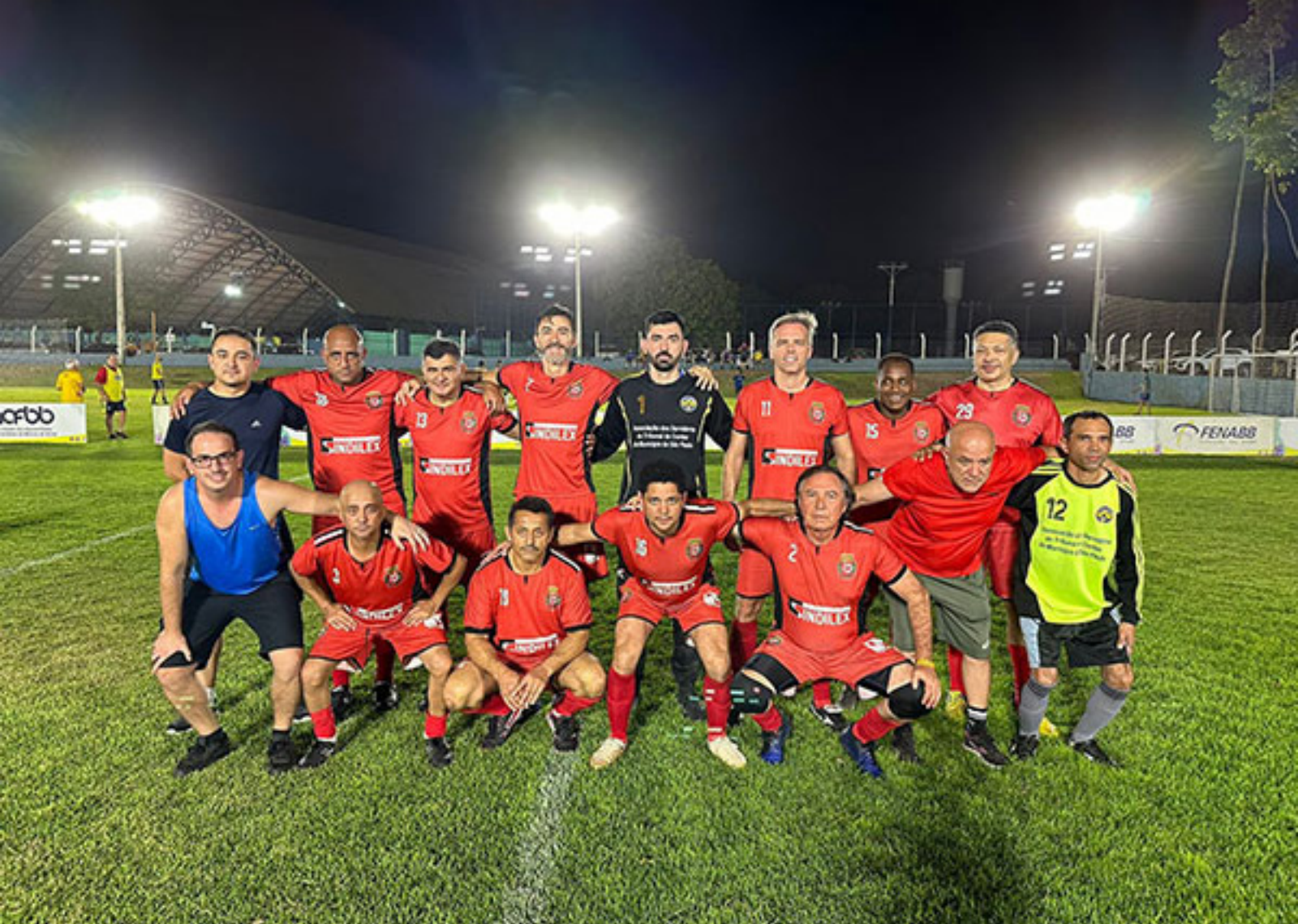
Equipe de futebol de São Paulo ▲