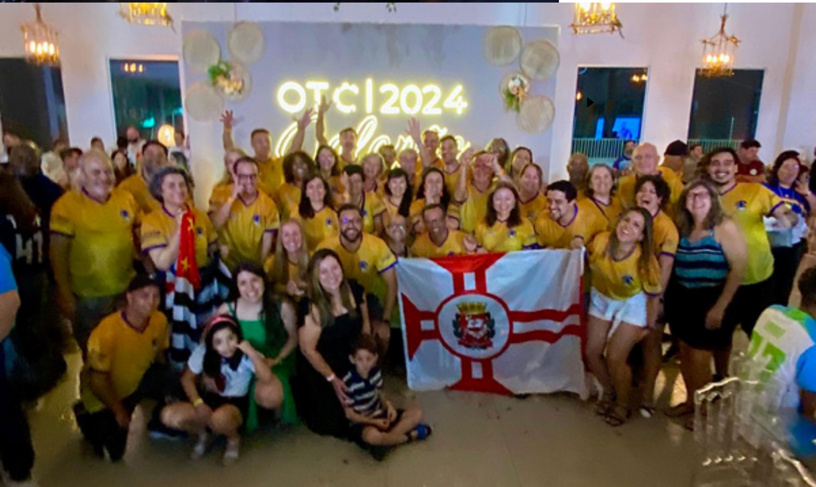
▲ Delegação de São Paulo