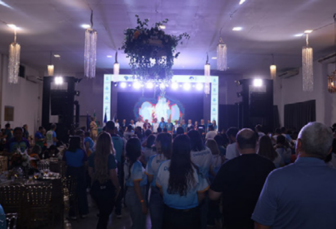
◀ Cerimonial e festa de abertura